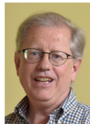
Bildungsclub Alois Hauser