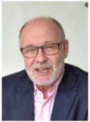
Präsident Beat Abegg